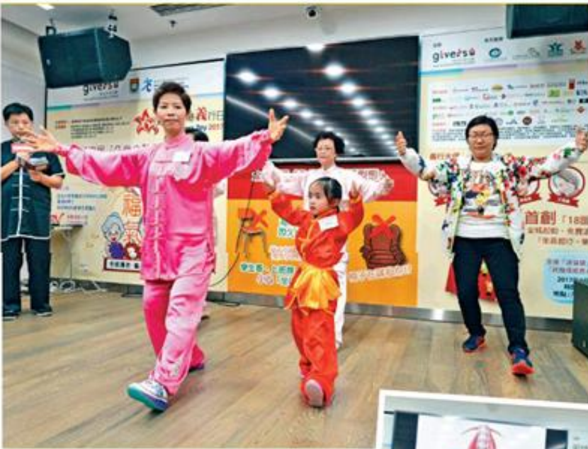
■參與調查的機構將舉辦「香港義行日」，教一些簡單伸展活動。

成日坐，懶走動，對健康有損無益。香港人長時間坐下，不論工作或假日休息都「唔願郁」，一項調查結果就發現，上班族在工作日平均坐着時間超過七百八十分鐘，有四分之一受訪上班族更坐足一千零三十八分鐘。有脊柱神經科醫生指，坐下時脊椎承受的壓力是站立時的二點三倍，不利身體，呼籲市民坐下工作時每小時要花五分鐘郁動身體。